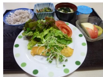
期間限定 健康定食（タンドリーフィッシュ）