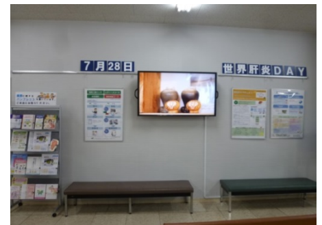
2階待合室ディスプレイ