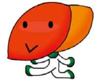
厚生労働省肝炎総合対策マスコットキャラクター